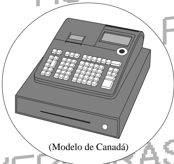
(Modelo de Canadá)